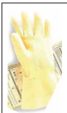
3882305 GUANTI ANSEL SATIN.DUZMOR 6,5/7