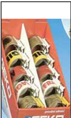
4763022 NASTRO IMBALLO CUTTER MM.50X33 MT.