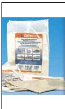
3781208 TELO NYLON COPRITUTTO 4X4 (GR.260)