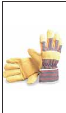
3898708 GUANTI PELLE MAIAL.ROV.E JEANS G52