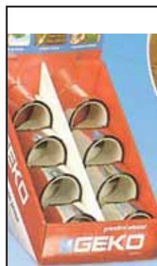
4767535 NASTRO SPAVENTAPASSERI 70X100 240/1