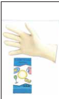
3882508 GUANTI LATTICE CONF.10/PZ."S"