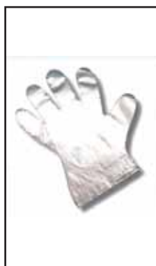
3882408 GUANTI NYLON PLT MONOUSO X 100 BUSTA