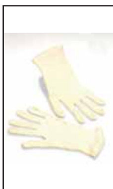
3895808 SOTTOGUANTO COTONE ECONOM.7-9 G83