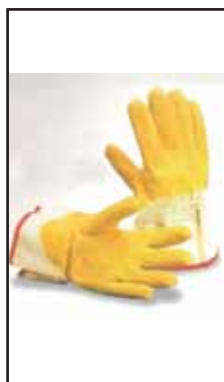
3895008 GUANTI LAVORO ANTITAGLIO G.108