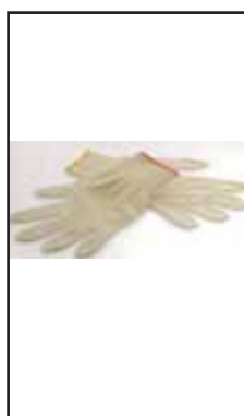
3895809 SOTTOGUANTO COTONE FILO CONT.7-9 82