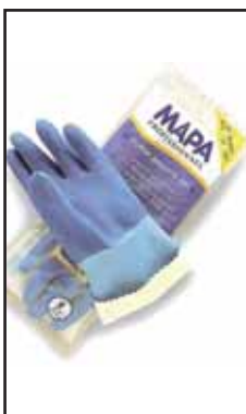
3884806 GUANTI MAPA 301 JERSETTE TERMI- CO