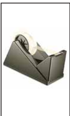
4767706 TENDINASTRO DA TAVOLO 33/66- 1300G