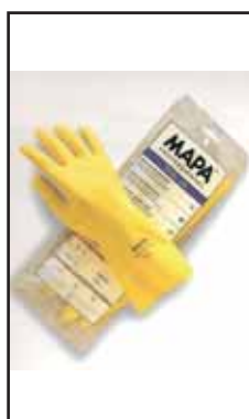
3884707 GUANTI GOMMA FE.MAPA CAS.124- 6/6,5