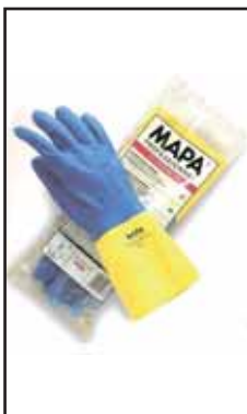
3885206 GUANTI MAPA TECHNICOLOR 405-6