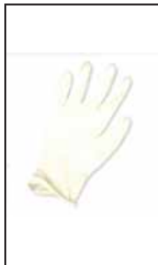
3882605 GUANTI LATTICE SC.100 SIA/SOF"S"