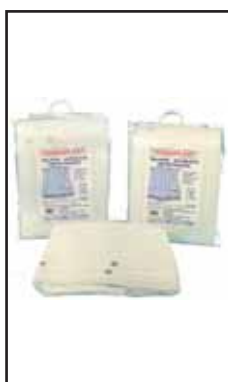
3782503 TENDA BALCONE PVC RETINATA/ OCCH.3X2