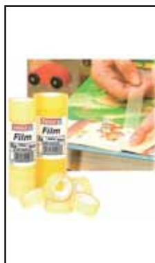
4753005 NASTRO AD.TRASP.TESAFILM 10X15 57386