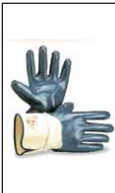
3896206 GUANTI N.B.R.BLU C/MANICH.M.10