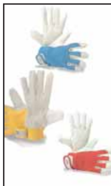
3890706 GUANTI P/FIORE+MAGLIA G36 ROSSO 7