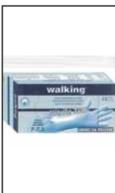
3882818 GUANTI NITRILE SC.100 WALKING SLMXL