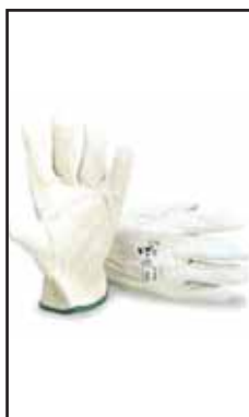
3891003 GUANTI PELLE BOVINA BIANCO M.7