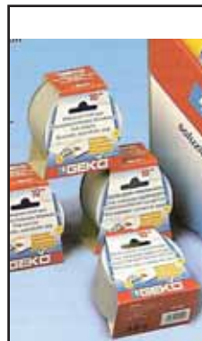
4767503 NASTRO AMERICANO SILVER MM.50X10 MT.