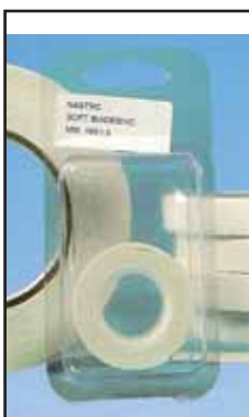
4759206 NASTRO BIAD.SOFT MT.1,5X19-H BL.GEKO