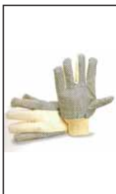
3895608 GUANTI GIARD.POLKA DORSO BIA.8