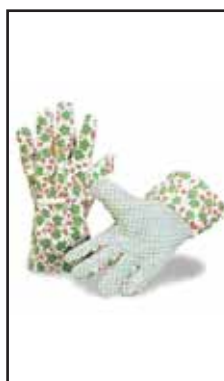
3895615 GUANTI GIARD.HOBBY 300 MIS. DONNA