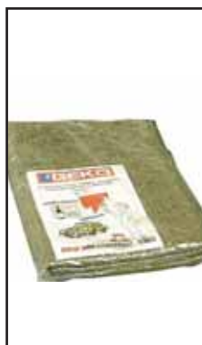
3781230 FELTRO PROTETT.ANTISCIVOLO MT.3X1