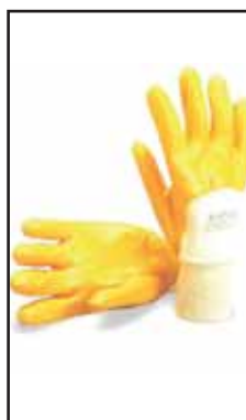
3896006 GUANTI NBR GIA.C/POLS.MAPA 397-7