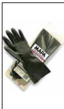
3885006 GUANTI IND.NERI MAPA 415 MIS.7/7,5