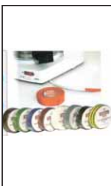
4757005 NASTRO AD.ISOLANTE TESA 10X15 60524