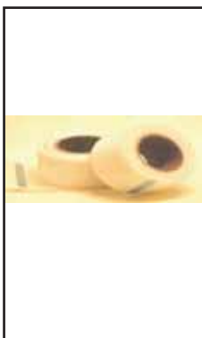
3899825 GARZA PER CARTONGESSO CM.5X20M 4240