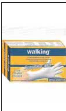
3882618 GUANTI LATTICE SC.100 WALKING SMLXL