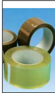
4763006 NASTRO IMBALLO AVANA PVC -66X50