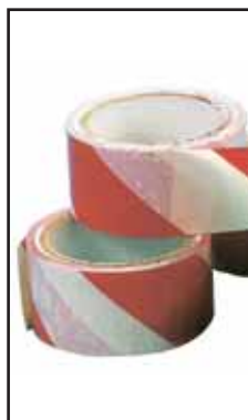
3899805 NASTRO SEGNALETICA MT.200x70h