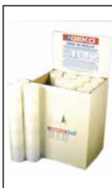
3782205 EMME BOLL X IMBALLO MT.10 S/S