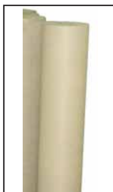
3781241 CARTONE ONDULATO ROTOLO MT.10X1