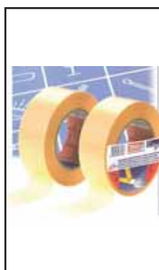
4758805 NASTRO BIADESIVO TESA 5X50 56170