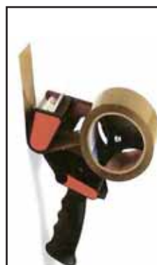
4767710 TENDINASTRO IMB.C/FRIZIONE 1302T