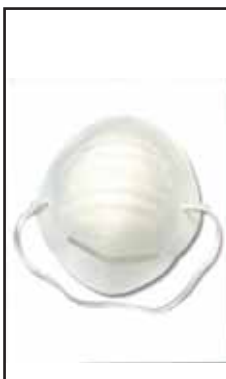
3899508 MASCHERINA ANTIPOLVERE CON- CHIGL.