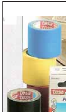
4767105 NASTRO TELATO TESA 2,75X38 56343