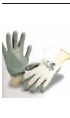
3895885 GUANTI SPALMATI GRIGIO N.B.R.G320-7