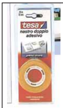
4759305 NASTRO BIADES.TESA 10X12 TRA- SP.64621