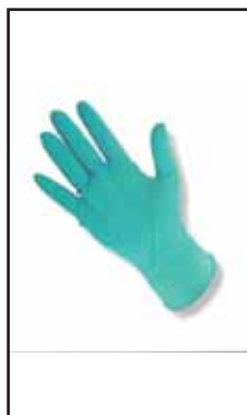
3882807 GUANTI NITRILE SC.100 SIAM "S"