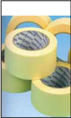
4760006 NASTRO AD.CARTA CARROZZERIA 19X50