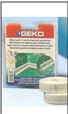
4767500 SANIBORD STRISCIA SIGILL. MM.22X2,4/M