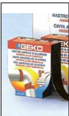
4767515 NASTRO EMME SMOKE ALTA TEMP.40X9 230