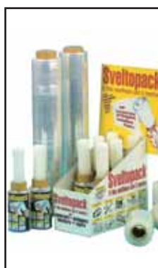
3782405 FILM ESTENSIBILE TRASP.H.500X300 MT.