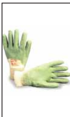
3895906 GUANTI NBR VERDE C/POLS.G.70R-7