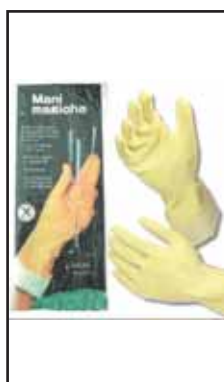
3881908 GUANTI GOMMA F.MANI MAG/ WALKING