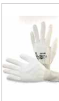
3895901 GUANTI SPALMATI BIANCO G85-7M